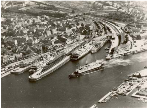
Fra havnen og færgeterminalen...