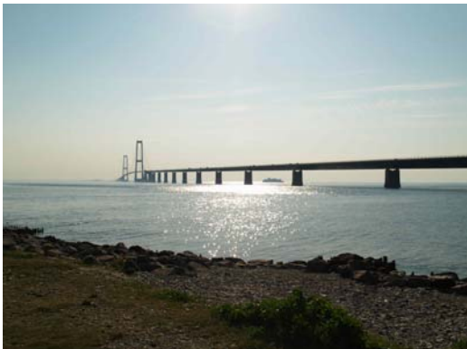
til Storebæltsbroen, stationen og motorvejen som omdrejningspunkt for udvikling