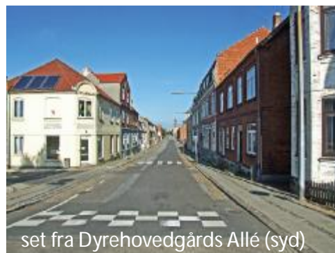
set fra Dyrehovedgårds Allé (syd)

BIRKEMOSEVEJ som her udmunder i Halsskovvej, er en SKOLEVEJ, her kører bybussen og der er en rimelig trafik. Som det ses, er der også her lavet en chikane i fine sten, som ikke dæmper farten, men som giver en ulidelig støj ved høje hastigheder. Det ses også,