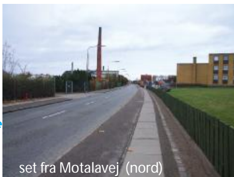
set fra Motalavej (nord)

dette vil være et fartdæmpende tiltag, aflaste Nyvej som en uvejsom parkeringsgade og skaffe tiltrængte p-muligheder for beboerne på Halsskovvej